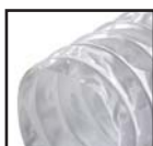
Белый ( )